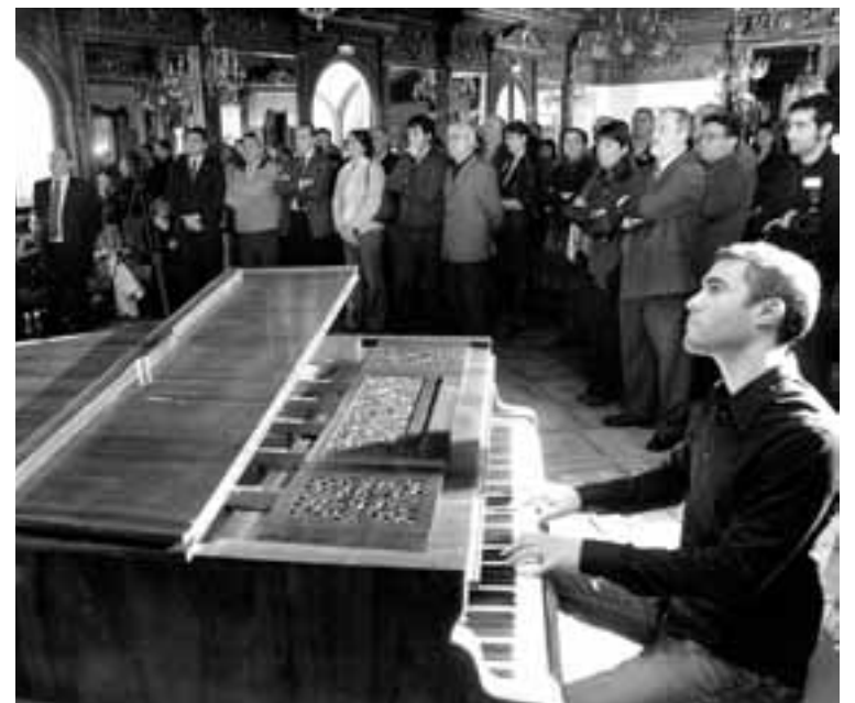
Un pianista toca durante la proyección. Al fondo, los asistentes.